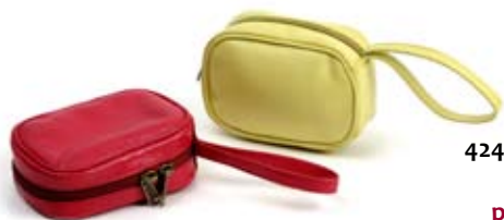
42495 Porta macchina digitale in pelle pistacchio - fragola, conf. 2, cm 12x8