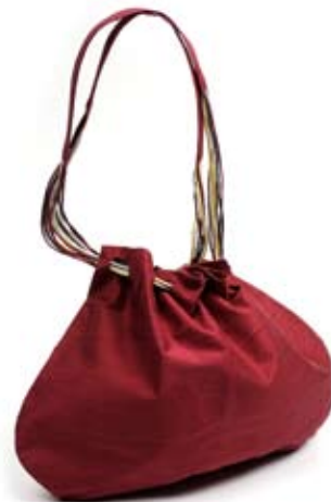
42472 Borsa Nilay in seta grezza fragola, cm 26x13x28, conf 1