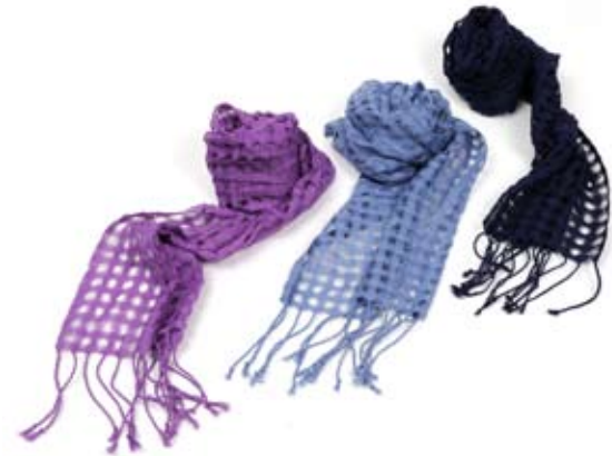
42417 Chalina Tere in cotone blu - glicine - azzurro, cm 150x32, conf 3