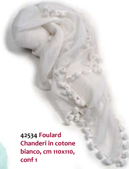
42534 Foulard Chanderi in cotone bianco, cm 110x110, conf 1

Foulard da portare come scialli o girati intorno al collo con le punte sul davanti per le più giovani. Ampi e leggeri in cotone chanderi con pom pom tutti attorno. In alternativa stampa con motivi tradizionali indiani su seta per un target più adulto. Note: Cotone lavare a 30°. Seta lavare a secco.