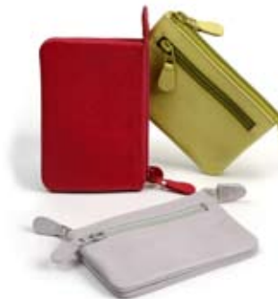
42500 Portamonete-portachivi in pelle pistacchio-fragola-glicine, cm 10,5x7, conf 3

Borsa in pelle di grandi dimensioni, manici lavorati a treccia. Dettaglio di cerchi metallici ai lati del manico. Foderata in cotone con taschina interna. Chiusura con lunga cerniera. Manico lungo da poter usare anche a tracolla. Target ampio e trasversale.