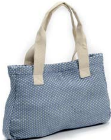
42423 Borsa Florecita di cotone azzurro, cm 40x25x5+60 conf 1