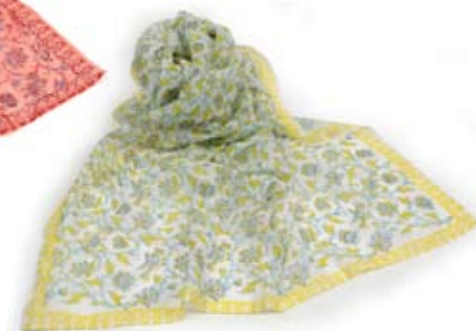
42538 Pareo India in voile di cotone stampato pistacchio, pistacchio, cm 180x90, conf 1