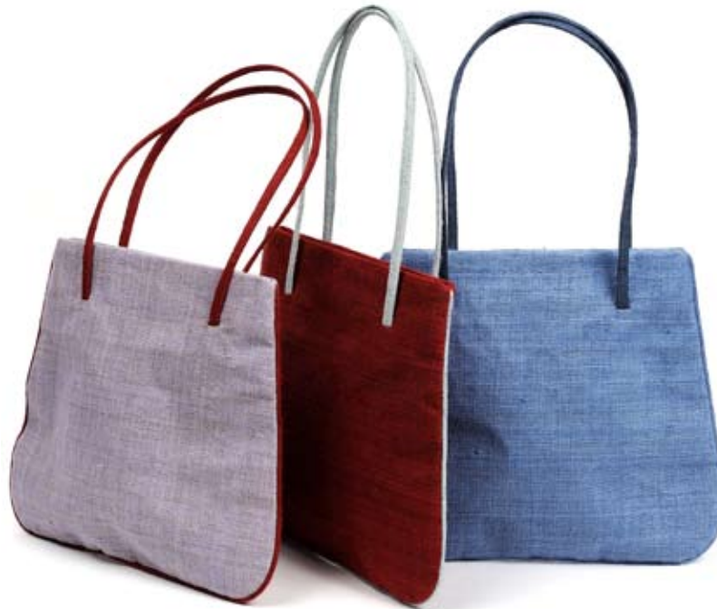
42442 Borsa Gaia in canapa blu - glicine - fragola, cm 35x29, conf 3