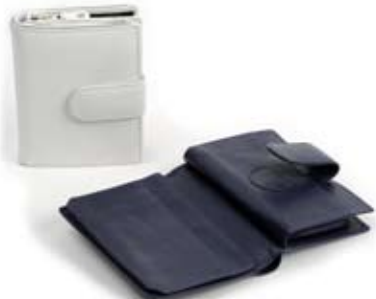
42488 Portafoglio medio donna blu - bianco, cm 9,5x15,5, conf 2