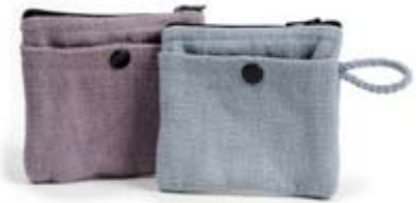
42907 Portamonete Lady in cotone azzurro e glicine, azzurro - glicine, conf 2