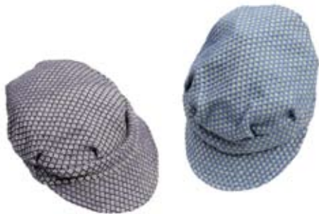
42427 Cappello Florecita di cotone azzurro - grigio, cm 19 diam, conf 2