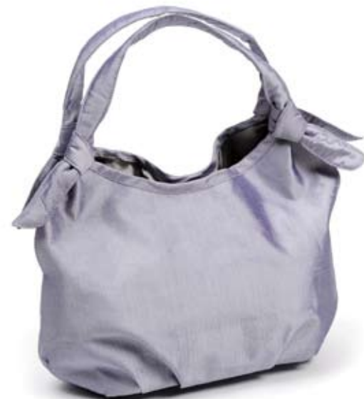
42454 Borsa Fiocco in seta con paillettes glicine, cm 28x19x11, conf 1

Borsina in seta cangiante con manici legati con fiocchi; foderata e con chiusura a clip interna. Base semirigida per mantenere la forma. Stile semplice e raffinato per le occasioni più eleganti. Target ampio. Note: Lavare a secco.