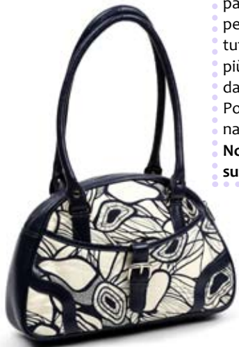
42501 Borsa Chicca in pelle e canvas stampato blu, cm 32x24+ 67, conf 1

Novità di questa primavera le borse in canvas o seta stampata con dettagli in pelle. Bauletto per tutti i giorni o borsa più ampia e raffinata da portare a mano. Portafogli coordinati. Target ampio. Note: Lavare il tessuto a mano.