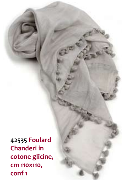
42535 Foulard Chanderi in cotone glicine, cm 110x110, conf 1