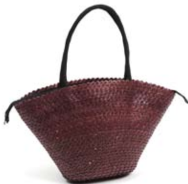
42511 Borsa Palm leaf in fibra fragola, cm 30/55x56h + 20x13 conf 2

Borse cilindriche con base ovale realizzate con intreccio di fibra di palma leggera e fili colorati di cotone. Fodera in cotone e chiusura con cordoncini multirighe e medaglioni tradizionali indiani. Parei in soffice cotone stampato artigianalmente, con motivi tradizionali indiani. Per uno stile etnico e colorato in spiaggia. Pubblico ampio.