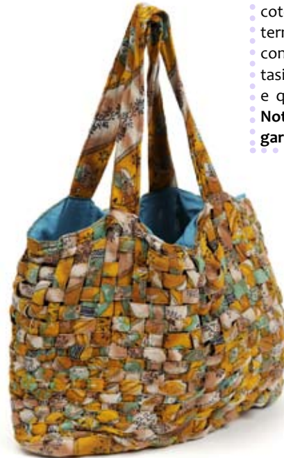
42528 Borsa Sari crossed in sari riciclato, conf 2, colori vari, cm 40x30h+cm 50x3, conf 2

Shopper piatta a completamento dell'assortimento best seller in plastica riciclata dai mercati vietnamiti. Fodera e manici in cotone. Spilla a fiore realizzata in carta riciclata: un vezzo buono per tutti. Per le più giovani.