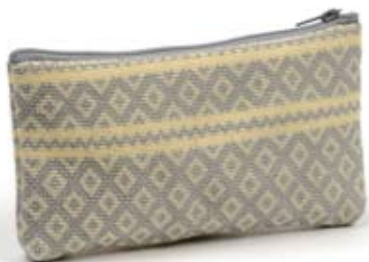
42541 Bustina Miriam in cotone con ricamo grigio, cm 19x10, conf 2

Ampia borsa in tessuto con disegno ad alveare realizzato direttamente a telaio. Elegante e pratica allo stesso tempo. Manici leggermente imbottiti e chiusura con clip interna. Fodera in cotone. Coordinati la bustina multiuso e il simpatico portachiavi a forma triangolare. Da proporre in primavera ad un pubblico adulto. Note: Lavare a mano.