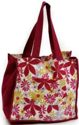
42428 Borsone "Beach" in canvas di cotone, colori vari, cm 36x33x18+cm 60x4, conf 2