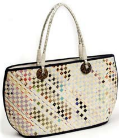
42505 Borsa "Cross" in carta riciclata e fibra, bianco&carta riciclata, cm 40x13x30h+ cm 2x55, conf 1