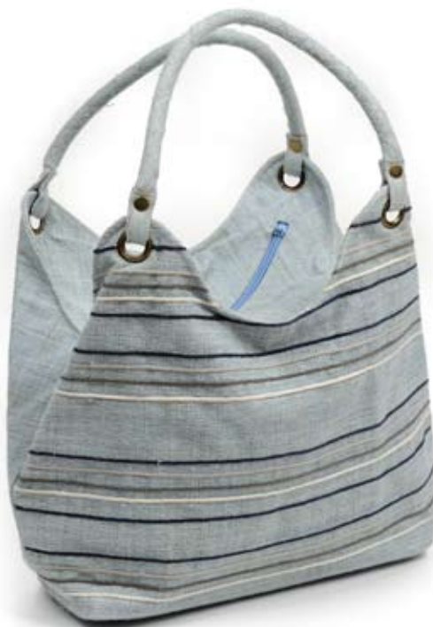
42447 Borsa Stripes in canapa azzurro, cm 28/40x27x14, conf 1