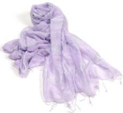
42455 Stola Shiny in seta opaca e lucida glicine, cm 160x80, conf 2

Stole in seta stropicciata con lavorazione di deep die a più colori o con applicazioni di paillettes ai lati. Giochi di opaco e lucido per un mix di seta e cotone con effetto super morbido. Per rinnovarsi con poco in tutte le occasioni. Target giovane e trasversale. Note: Lavare a secco.