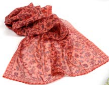
42537 Pareo India in voile di cotone stampato fragola, cm 180x90, conf 1