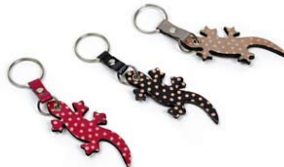
42480 Portachiavi Jeko in pelle blu - grigio - fragola, cm 14x4, conf 3

Novità di questa primavera la pelle stampata con motivi floreali in tono su tono per un coordinato semplice, femminile ed originale. La borsa ha un ampio manico. Chiusura con cerniera ed è foderata in cotone. Coordinati il portamonete ed il portafogli. Da proporre in primavera ad un target adulto.