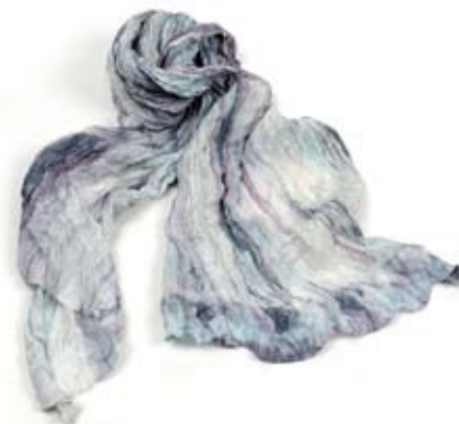
42458 Stola Fumè in seta stropicciata, bianco, glicine, grigio e azzuro polvere, cm 160x80, conf 2