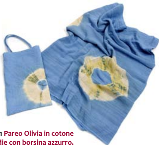
42521 Pareo Olivia in cotone Tye&die con borsina azzurro, cm 180x60, conf 2