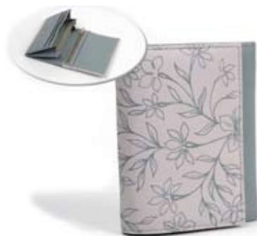
42477 Portafoglio Spring in pelle stampa, grigio e glicine, cm 12,5x11, conf 2