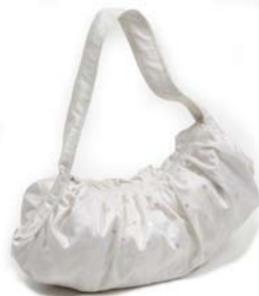
42468 Borsa Gurjari in seta grezza con paillettes bianco, cm 40x26+cm 75, conf 1

Ampia borsa dalla forma ovale. Realizzata in seta grezza e foderata in cotone stampato artigianalmente con la tecnica del blockprinting. Manici originali realizzati in sottili tubolari di seta multicolore; giocando coi manici si chiude la borsa. Coordinati nei colori della seta sono disponibili gli elastici doppi per capelli. Note: Lavare a secco.