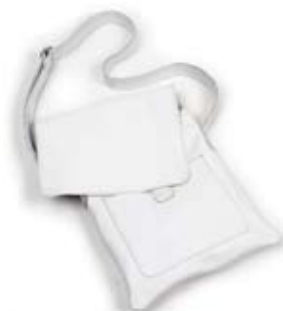
42481 Borsa Mithu in pelle bianco, cm 28x32x140, conf 1