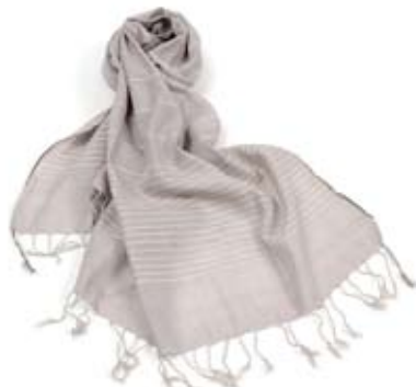
42432 Stola Stripes in seta e cotone glicine e bianco, 180x60, conf 2