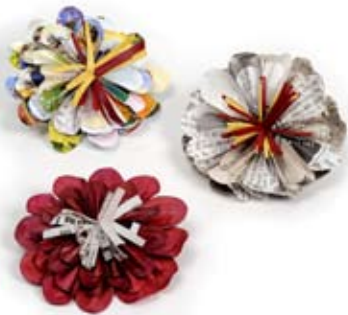
42512 Spilla in carta riciclata, colori vari, cm 9 diam, conf 3

Shopper piatta a completamento dell'assortimento best seller in plastica riciclata dai mercati vietnamiti. Fodera e manici in cotone. Spilla a fiore realizzata in carta riciclata: un vezzo buono per tutti. Per le più giovani.