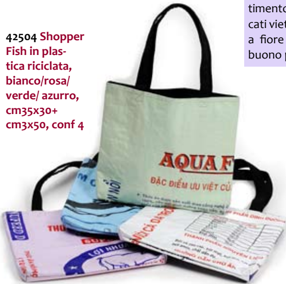
42504 Shopper Fish in plastica riciclata, bianco/rosa/verde/azzurro, cm35x30+cm3x50, conf 4