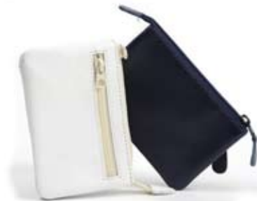
42499 Portamonete - portachivi in pelle blu - bianco, cm 10,5x7, conf 2

Borsa in pelle di grandi dimensioni, manici lavorati a treccia. Dettaglio di cerchi metallici ai lati del manico. Foderata in cotone con taschina interna. Chiusura con lunga cerniera. Manico lungo da poter usare anche a tracolla. Target ampio e trasversale.