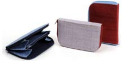
42445 Portamonete Gaia in canapa blu - glicine - fragola, cm 16x11, conf 3