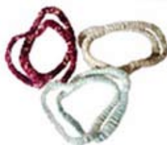
42466 Elastico doppio x capelli Nita in cotone con blockprinting azzurro polvere/ grigio/fragola, unica, conf 3