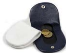
42490 Portamonete Emma in pelle blu - bianco, cm 7x7, conf 2