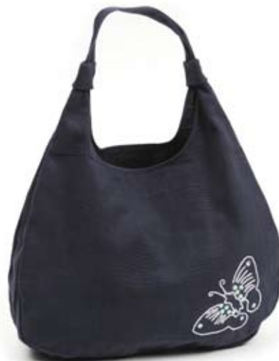
42473 Borsa Mariposa in canvas di cotone con ricamo blu, cm 40x38, conf 1