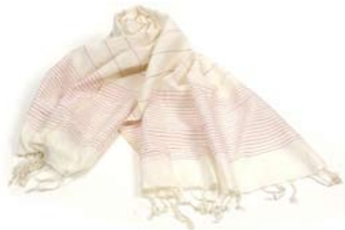
42431 Stola Stripes in seta e cotone bianca e fragola, 180x60, conf 2

Ampie stole in tessuto misto di seta e cotone con ricamo realizzato direttamente a telaio di righe sottili che valorizzano e danno movimento. Seta Thussar o grezza impreziosita da applicazioni di paillettes e ricami artigianali per le occasioni di festa. Target adulto. Note: Lavare a secco.