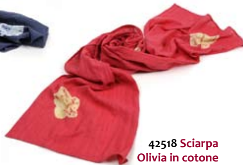
42518 Sciarpa Olivia in cotone tye&die fragola, cm 200x40, conf 2