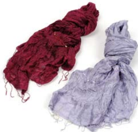
42460 Stola Wrinkled in seta con paillettes glicine - fragola, cm 160x60, conf 2