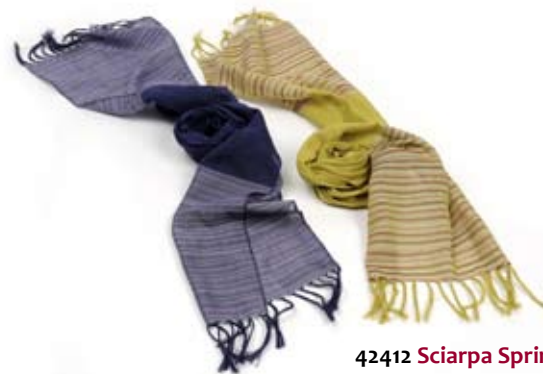
42412 Sciarpa Spring in cotone a righe, blu/pistacchio, cm 170x65, conf 2