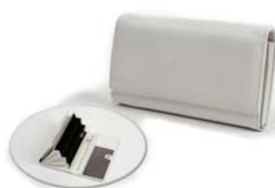
42497 Portafoglio grande donna in pelle bianco, cm 19x11, conf 2