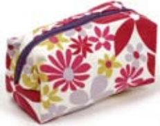
42429 Bustina "Beach" in canvas di cotone, colori vari, cm 18x18, conf 2

Borsa rettangolare in canvas di cotone stampato con motivo estivo e floreale. Chiusura con clip interna e tasca esterna. Coordinata la bustina multiuso con cerniera. Target giovane. Note: Lavare a 30°