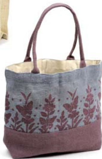
42438 Borsa Spring in juta grigio e glicine, cm 40x30x10+cm50, conf 2

Borse rettangolari in juta con stampe colorate e disegni ispirati alla natura. Per usi quotidiani e ottimi da proporre per una "spesa naturale". Note: Lavare a mano.