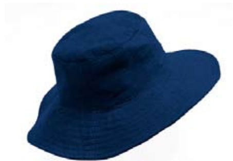
42545 Cappello Asia in cotone blu, diam cm 19/15x8,7+cm 8, conf. 2