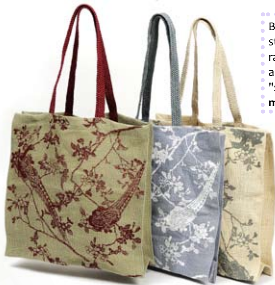
42437 Shopper Trees 011 in juta pistachio - grigio - bianco, cm 40x40x10+cm 60, conf 3

Borse rettangolari in juta con stampe colorate e disegni ispirati alla natura. Per usi quotidiani e ottimi da proporre per una "spesa naturale". Note: Lavare a mano.