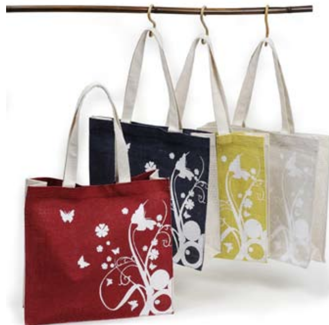
42527 Borsa Butterfly in juta stampata, conf 4, blu/pistacchio/fragola/glicine, cm 38x35