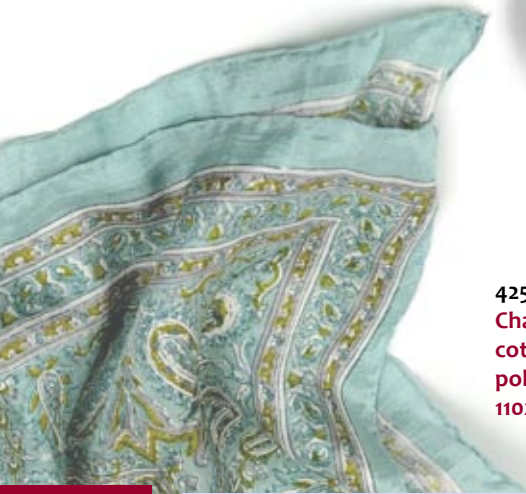
42536 Foulard Chanderi in cotone azzurro polvere, cm 110x110, conf 1