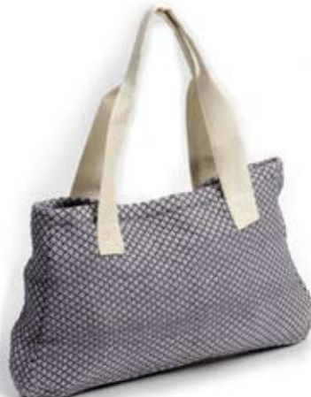
42424 Borsa Florecita di cotone grigio, cm 40x25x5+60, conf 1