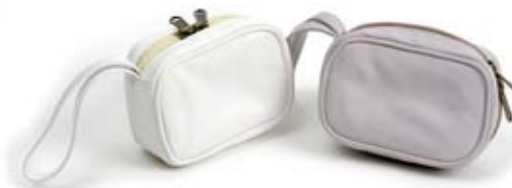
42494 Porta macchina digitale in pelle glicine - bianco, cm 12x8, conf 2