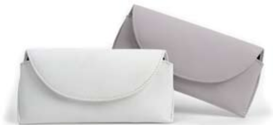
42492 Portaocchiali in pelle glicine - bianco, cm 17x7h, conf 2