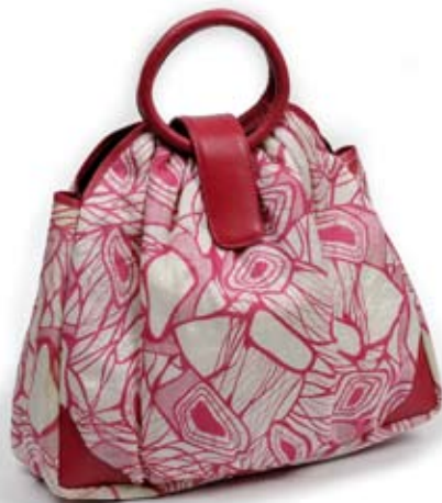
42502 Borsa Marika in pelle e seta stampata fragola, cm 40x30x12, conf 1