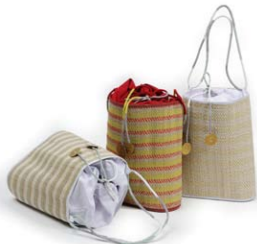
42526 Borsa Funny beach in fibra colorata, pistacchio/bianco/fragola, cm 27x34hx11, conf 3

Borse cilindriche con base ovale realizzate con intreccio di fibra di palma leggera e fili colorati di cotone. Fodera in cotone e chiusura con cordoncini multirighe e medaglioni tradizionali indiani. Parei in soffice cotone stampato artigianalmente, con motivi tradizionali indiani. Per uno stile etnico e colorato in spiaggia. Pubblico ampio.