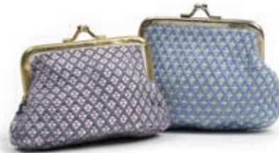
42426 Portamonete Florecita di cotone azzurro - grigio, cm 13x7x4,5, conf 2

Borsa tessuta e ricamata con disegno tradizionale Florecita direttamente a telaio. Manici in canvas e chiusura con clip interna. Coordinati il simpatico e originale cappellino ed il portamonete stile vintage. Semplice borsa ovale e beauty cilindrico con fili colorati a personalizzare. Target giovane. Note: Lavare a mano.