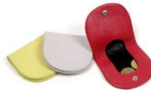
42491 Portamonete Emma in pelle pistacchio - fragola - glicine, cm 7x7, conf. 3

Accessori in pelle pratici e ottimi come idee regalo: il portaocchiali semirigido e allungato rispetto alle versioni precedenti e il porta macchina digitale leggermente imbottito. Coordinati nei nuovi colori della collezione. Pubblico ampio.