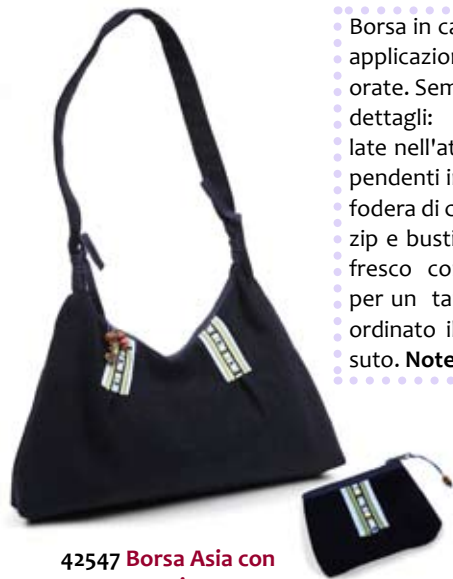
42547 Borsa Asia con portamonete in cotone blu, cm 41x24, conf. 2

Borsa in canvas di cotone e applicazioni tradizionali colorate. Semplice e curata nei dettagli: fettucce arrotondate nell'attacco dei manici, pendenti in legno e perline, fodera di cotone, chiusura a zip e bustina annessa. Stile fresco con dettagli etnici per un target giovane. Coordinato il cappello in tessuto. Note: Lavare a 30°.