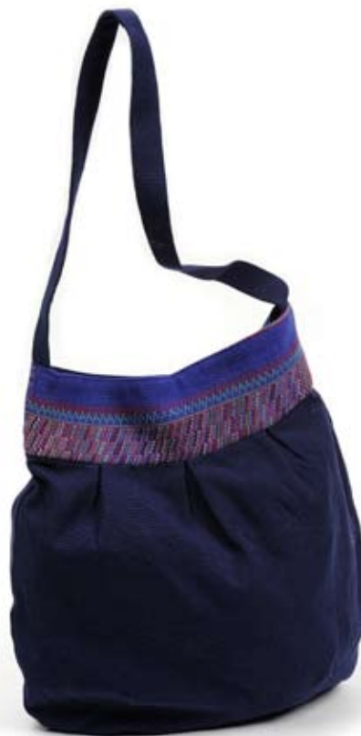
42420 Borsa ovale in Huipil di cotone blu, cm 40x35x30+100x2, conf 1