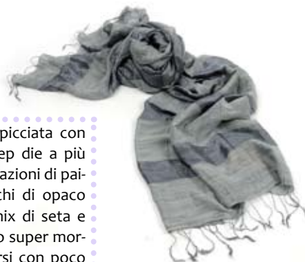
42456 Stola Shiny in seta opaca e lucida grigio, cm 160x80, conf 2

Stole in seta stropicciata con lavorazione di deep die a più colori o con applicazioni di paillettes ai lati. Giochi di opaco e lucido per un mix di seta e cotone con effetto super morbido. Per rinnovarsi con poco in tutte le occasioni. Target giovane e trasversale. Note: Lavare a secco.