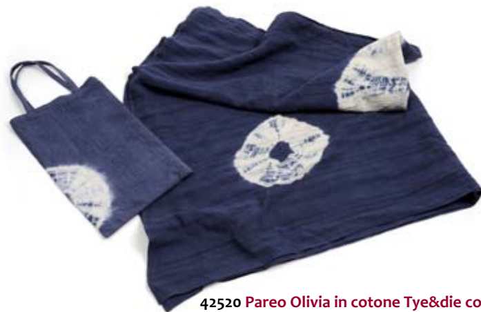
42520 Pareo Olivia in cotone Tye&die con borsina blu, cm 180x60, conf 2

Borsa, pareo, sciarpa e cappello assortimento completo per il mare. Ogni prodotto è realizzato in leggero cotone, garza per pareo e sciarpa; lavorato con stampe artigianali tye&die. La borsa è ampia e a doppio strato per renderla ancora più resistente; preziosa la stampa artigianale a fiori in posizione asimmetrica, manici in bamboo. Parei con lavorazioni diverse di tye&die per gusti più raffinati o stravaganti, e dotati di pratica bustina in cotone coordinata. Scarpe lunghe e leggere per ripararsi dal vento marittimo; cappellini doubleface per ripararsi dal sole. Target giovane. Note: Lavare a mano