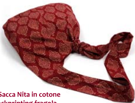
42465 Sacca Nita in cotone con blockprinting fragola, cm 35x35x45, conf 2