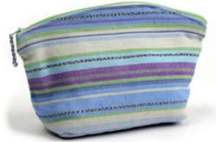
42416 Bustina Tere in cotone azzurro, azzurro polvere cm 14/18x12x8, conf 2

Righe tradizionali guatemalteche realizzate a telaio in un resistente tessuto di cotone. Borsa a sacca con base, laccetti per chiuderla e fodera in cotone. Coordinati a multirighe colorate la pratica bustina, la fascia per i capelli con elastico e l'ampio e fresco pareo. Note: Lavare a mano.