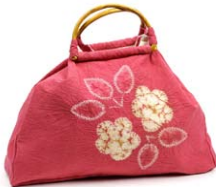
42515 Borsa Olivia in cotone con tye&die fragola, cm 45x35, conf 1