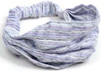
42413 Fascia per capelli Tere011 in cotone, colori vari, taglia unica, conf 2