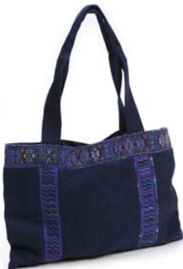
42419 Shopper in Huipil di cotone blu, cm 40x25+105x3, conf 1