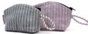
42554 Portamonete Muzza in cotone grigio - glicine, cm 14x9x4, conf 2