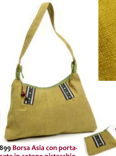
42899 Borsa Asia con portamonete in cotone pistacchio, cm 41x24, conf. 2