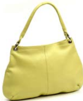
42484 Borsa Duffel in pelle pistacchio, cm 42x28x45, conf 1