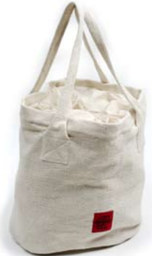
42900 Borsa Beach in cotone bianco, cm 28 diamx35+cm 65, conf 1