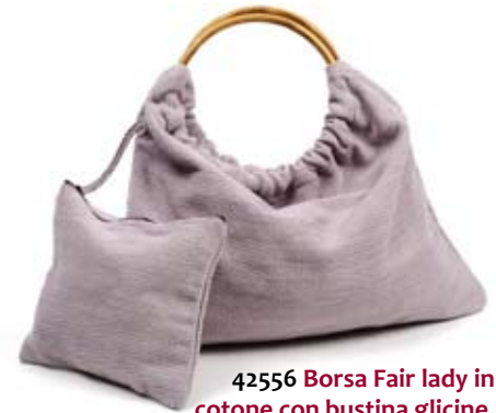
42556 Borsa Fair lady in cotone con bustina glicine, cm 45x30, conf 1

Borsa in canvas di cotone tessuto e fodera in cotone lavorato a tie & die. Particolare manico a cerchio in bamboo. Pratica bustina annessa alla borsa. La borsa può essere utilizzata doubleface per due stili diversi: uno più semplice e classico, uno più estroso che valorizza la stampa artigianale. Coordinati il portamonete e le bustine porta macchina digitale con chiusura a zip. Note: Lavare a mano.