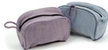
42901 Portadigitale Lady in cotone azzurro - glicine, cm 12x10x6, conf 2