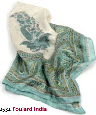
42532 Foulard India in seta stampata, colori vari, cm 90x90, conf 2

Foulard da portare come scialli o girati intorno al collo con le punte sul davanti per le più giovani. Ampi e leggeri in cotone chanderi con pom pom tutti attorno. In alternativa stampa con motivi tradizionali indiani su seta per un target più adulto. Note: Cotone lavare a 30°. Seta lavare a secco.