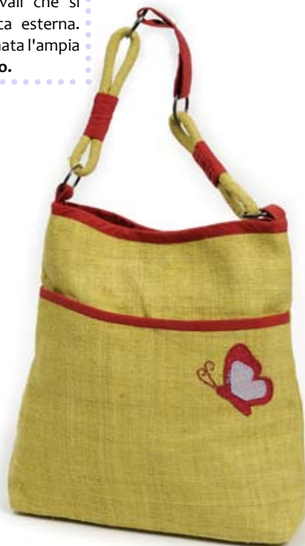
42440 Borsa Butterfly in canapa pistacchio, cm 33x30x8, conf 2

Borsa ampia a tracolla con patella, in canapa. Per tutti i giorni. Manico regolabile e fodera in cotone. Stile semplice e pratico, per gli amanti dei tessuti naturali. Target giovane ed unisex. Note: Lavare a mano.