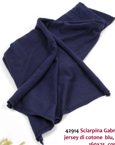
42914 Sciarpina Gabri in jersey di cotone blu, cm 160x25, conf 2