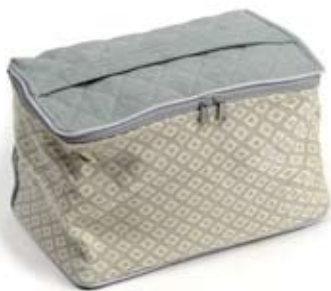
42542 Beauty Miriam in cotone con ricamo grigio, cm 24x18x14, conf 1