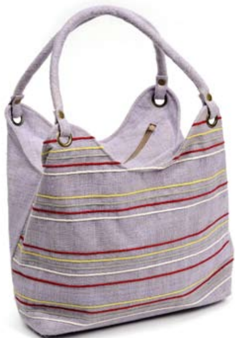
42446 Borsa Stripes in canapa glicine, cm 28/40x27x14, conf 1