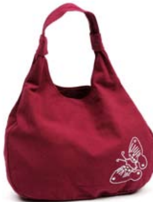
42475 Borsa Mariposa in canvas di cotone con ricamo fragola, cm 40x38, conf 1

Simpatica borsina in leggero canvas di cotone. Forma arrotondata, dettaglio di farfalla stilizzata e ricamata con filo di cotone e paillettes. Fodera in cotone e chiusura con clip interna. Target giovane. Note: Lavare a mano.