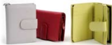
42489 Portafoglio medio donna pistacchio - fragola - glicine, cm 9,5x15,5, conf 3