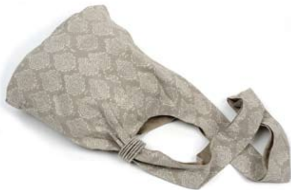
42464 Sacca Nita in cotone con blockprinting grigio, cm 35x35x45, conf 2