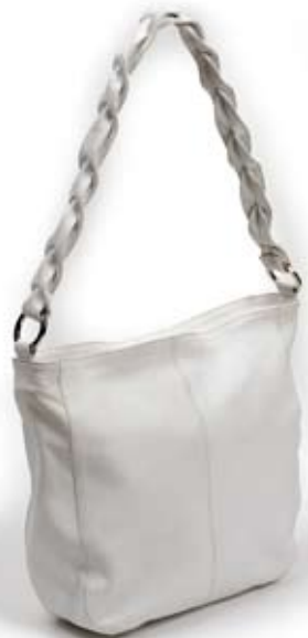
42486 Borsa Braid in pelle bianco, cm 35x33x85, conf 1

Pratico accessorio in pelle che funge sia da portamonete che da portachivi con un anello metallico interno ed estraibile. Taschina esterna laterale. Coordinato nei nuovi colori della collezione. Target giovane.