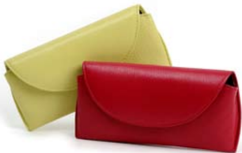
42493 Portaocchiali in pelle pistacchio - fragola, cm 17x7h, conf 2

Accessori in pelle pratici e ottimi come idee regalo: il portaocchiali semirigido e allungato rispetto alle versioni precedenti e il porta macchina digitale leggermente imbottito. Coordinati nei nuovi colori della collezione. Pubblico ampio.