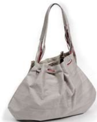
42471 Borsa Nilay in seta grezza glicine, cm 26x13x28, conf 1