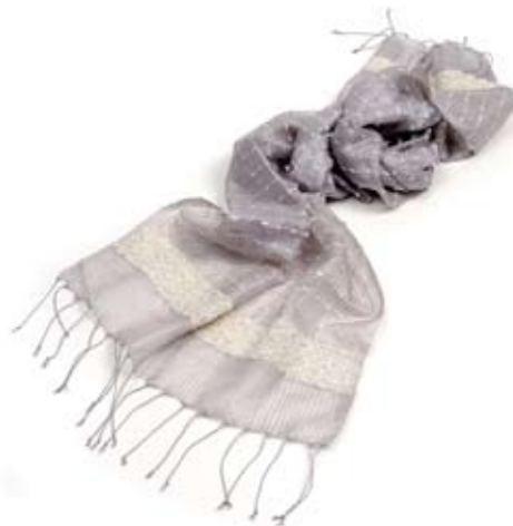
42533 Stola Devika in seta, colori vari, cm 160x50, conf 1

Stole in sete diverse: lavorate in trasparenza con applicazioni di piccoli bozzoli; con inserti di viscosa o a righe di dimensioni differenti. Stili diversi per ogni gusto e occasione. Target ampio. Note: Lavare a secco.