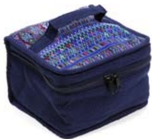
42418 Beauty in Huipil di cotone blu, cm 16x16x8, conf 2

Borsa ovale, beauty rettangolare e shopper piatta in resistente cotone tessuto a telaio, tutti impreziositi da applicazioni di Huipiles riciclati. In Guatemala ogni etnia ha una propria casacca con disegni e colorazioni diverse i Huipiles; qui riciclati in nuova vita su accessori che diventano unici. Target ampio.