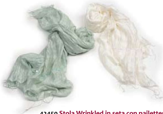
42459 Stola Wrinkled in seta con paillettes bianco - azzurro, cm 160x60, conf 2