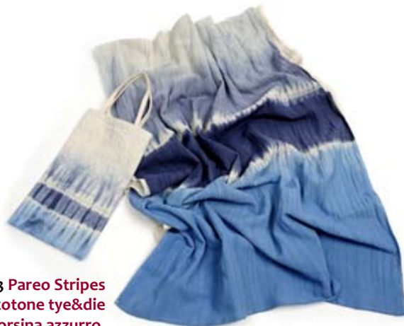
42523 Pareo Stripes in cotone tie&die con borsina azzurro, cm 180x60, conf 2