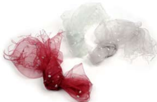
42529 Stola Snow in seta, azzurro polvere/fragola/glicine, cm 180x70, conf 3

Un'altra qualità della seta è la sua capacità di trattenere i colori, anche di tipo naturale, permettendo quindi di avere un prodotto completamente naturale