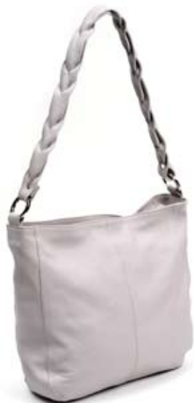
42487 Borsa Braid in pelle glicine, cm 35x33x85, conf 1