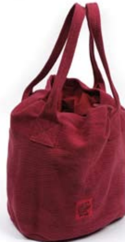
42550 Borsa Beach in cotone fragola, cm 28 diamx35+cm 65, conf 1

Borsa cilindrica in resistente canvas di cotone. Base circolare estraibile per il lavaggio. Fodera in cotone e chiusura con lacci. Molto capiente e adatta alla spiaggia. Target ampio. Note: Lavare a 30°.