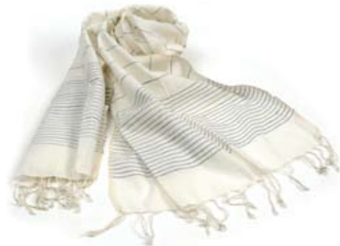
42430 Stola Stripes in seta e cotone bianca e blu, 180x60, conf 2

Ampie stole in tessuto misto di seta e cotone con ricamo realizzato direttamente a telaio di righe sottili che valorizzano e danno movimento. Seta Thussar o grezza impreziosita da applicazioni di paillettes e ricami artigianali per le occasioni di festa. Target adulto. Note: Lavare a secco.