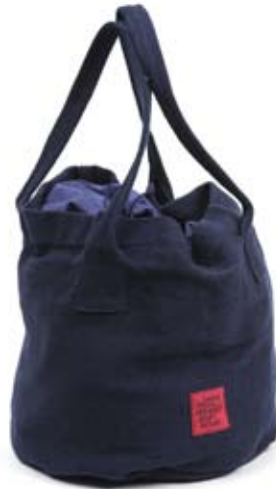
42549 Borsa Beach in cotone blu indigo, cm 28 diamx35+cm 65, conf 1