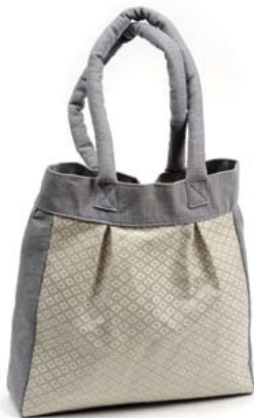
42539 Borsa Miriam in cotone con ricamo grigio, cm 35x30x8+cm60x2, conf 1

Ampia borsa in tessuto con disegno ad alveare realizzato direttamente a telaio. Elegante e pratica allo stesso tempo. Manici leggermente imbottiti e chiusura con clip interna. Fodera in cotone. Coordinati la bustina multiuso e il simpatico portachiavi a forma triangolare. Da proporre in primavera ad un pubblico adulto. Note: Lavare a mano.