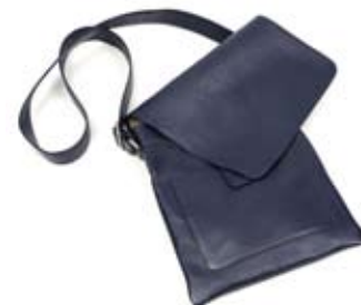
42482 Borsa Mithu in pelle blu indigo, cm 28x32x140, conf 1

Borsa in morbida pelle piatta da portare a tracolla, con patella e tasche interne. Manico lungo e regalabile. Non foderata. Pubblico giovane ed unisex.