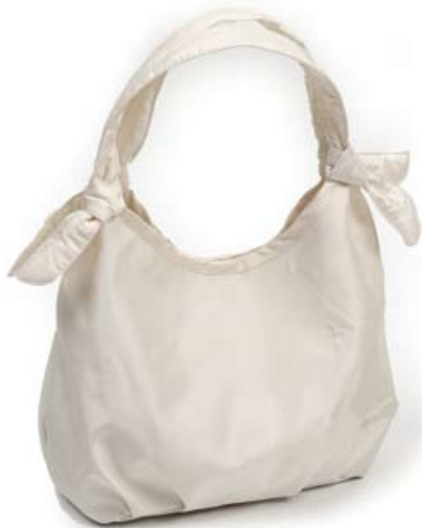
42452 Borsa Fiocco in seta con paillettes bianco, cm 28x19x11, conf 1