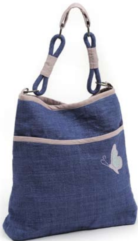
42439 Borsa Butterfly in canapa blu, cm 33x30x8, conf 2

Ampia borsa in canapa con dettagli in morbida pelle scamosciata a contrasto di colore. Originale il manico ad ovali che si intersecano. Chiusura pratica con cerniera e tasca esterna. Farfallina coordinata applicabile come spilla. Coordinata l'ampia bustina multiuso. Target ampio. Note: Lavare a mano.