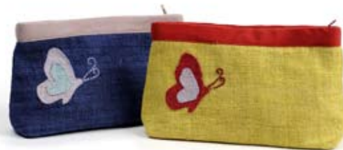
42441 Bustina Butterfly in canapa blu - pistacchio, cm 11,5x19x4,5, conf 2

Borsa ampia a tracolla con patella, in canapa. Per tutti i giorni. Manico regolabile e fodera in cotone. Stile semplice e pratico, per gli amanti dei tessuti naturali. Target giovane ed unisex. Note: Lavare a mano.