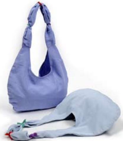
42421 Borsa ovale Playa di cotone azzurro - glicine, cm 26/36x37+50x5, conf 2

Borsa tessuta e ricamata con disegno tradizionale Florecita direttamente a telaio. Manici in canvas e chiusura con clip interna. Coordinati il simpatico e originale cappellino ed il portamonete stile vintage. Semplice borsa ovale e beauty cilindrico con fili colorati a personalizzare. Target giovane. Note: Lavare a mano.