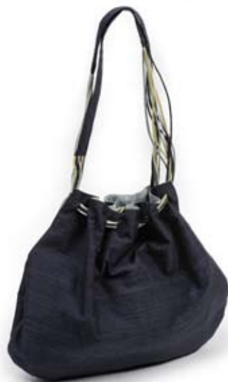
42470 Borsa Nilay in seta grezza blu, cm 26x13x28, conf 1