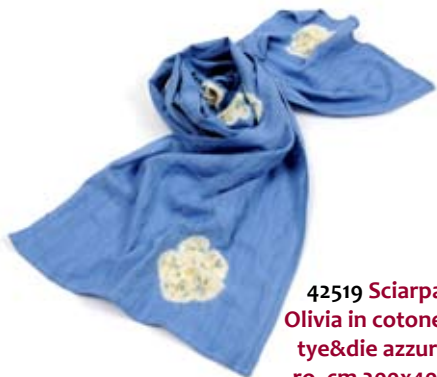
42519 Sciarpa Olivia in cotone tie&die azzurro, cm 200x40, conf 2