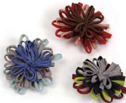
42451 Spille Organza a fiore, colori vari, cm 5 diam, conf 6

Borsina in seta cangiante con manici legati con fiocchi; foderata e con chiusura a clip interna. Base semirigida per mantenere la forma. Stile semplice e raffinato per le occasioni più eleganti. Target ampio. Note: Lavare a secco.