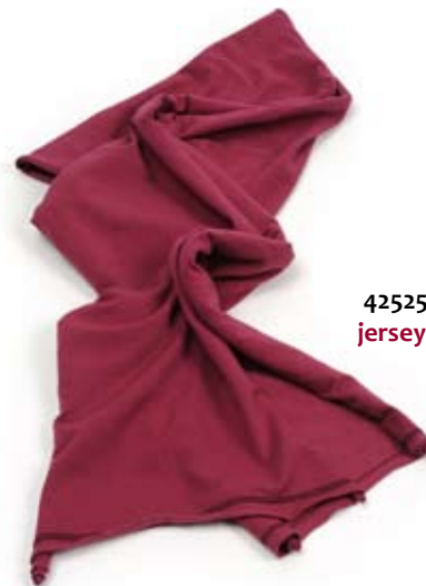
42525 Sciarpina Gabri in jersey di cotone fragola, cm 160x25, conf 2