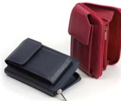
42479 Portacellulare in pelle blu - fragola, cm 12x8, conf 2

Nuovo accessorio in pelle: il portacellulare con un comparto portamonete con zip. Nuovi anche i portachiavi in pelle a forma di jeko. Target unisex.