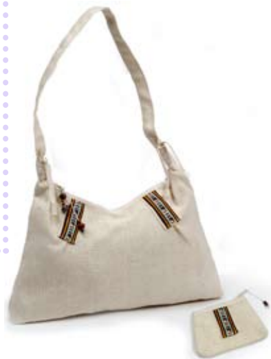
42548 Borsa Asia con portamonete in cotone bianco, cm 41x24, conf. 2

Borsa in canvas di cotone e applicazioni tradizionali colorate. Semplice e curata nei dettagli: fettucce arrotondate nell'attacco dei manici, pendenti in legno e perline, fodera di cotone, chiusura a zip e bustina annessa. Stile fresco con dettagli etnici per un target giovane. Coordinato il cappello in tessuto. Note: Lavare a 30°.