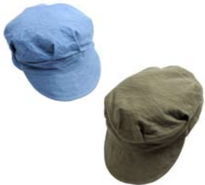
42516 Cappello Olivia doubleface in cotone, blu e celeste/fragola e pistacchio cm 20x(5+3), conf 2