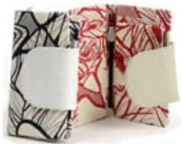
42503 Portafoglio Chicca in pelle e canvas stampato blu-fragola, cm 16,5x9, conf 2