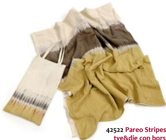
42522 Pareo Stripes in cotone tie&die con borsina pistacchio, cm 180x60, conf 2