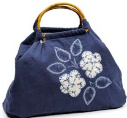
42514 Borsa Olivia in cotone con tye&die blu, cm 45x35, conf 1