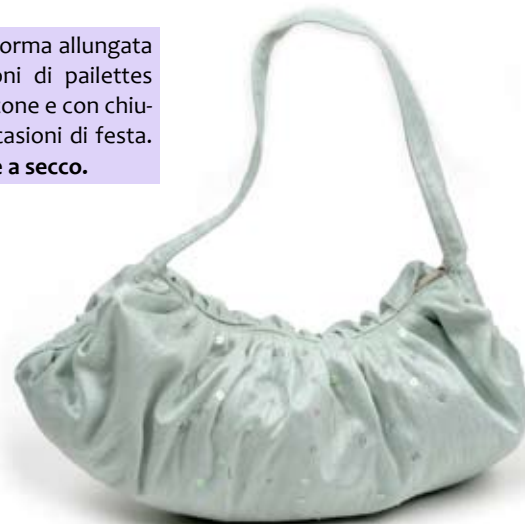
42469 Borsa Gurjari in seta grezza con paillettes azzurro polvere, cm 40x26+cm 75, conf 1

Borsa in seta grezza dalla forma allungata e morbida, con decorazioni di paillettes trasparenti. Foderata in cotone e con chiusura lunga a zip. Per le occasioni di festa. Target adulto. Note: Lavare a secco.