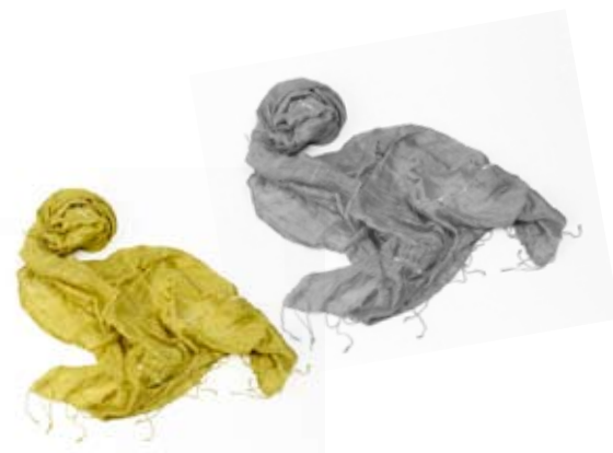
42461 Stola Wrinkled in seta con paillettes grigio - pistacchio, cm 160x60, conf 2