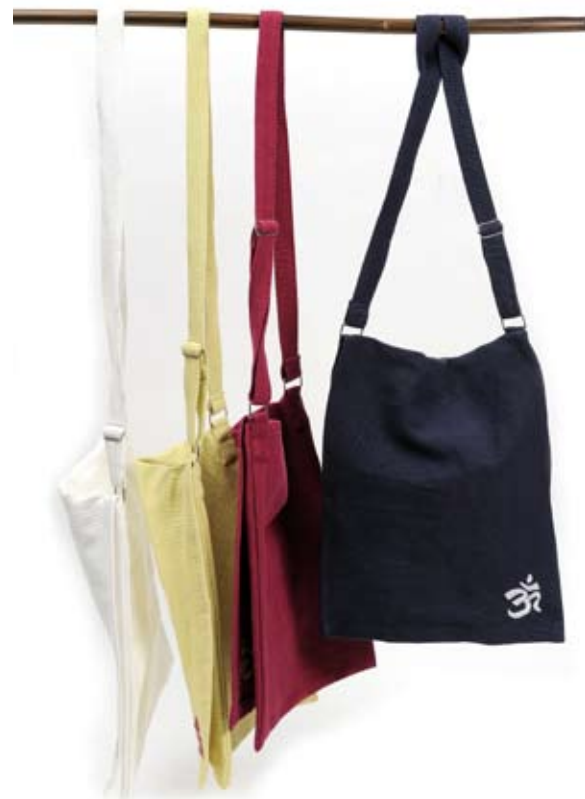
42462 Borsa Om in canvas di cotone con manici regolabili, conf 4, blu/pistacchio/fragola/bianco, cm 38,5x31,5x110

Borsa in leggero e resistente canvas di cotone, profonda e con patella. Manici lunghi e regolabili. Rinnovata nei colori e nel dettaglio del ricamo con il simbolo Ohm. Target giovane. Note: Lavare a 30°.