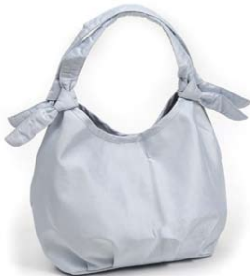
42453 Borsa Fiocco in seta con paillettes azzurro polvere, cm 28x19x11, conf 1