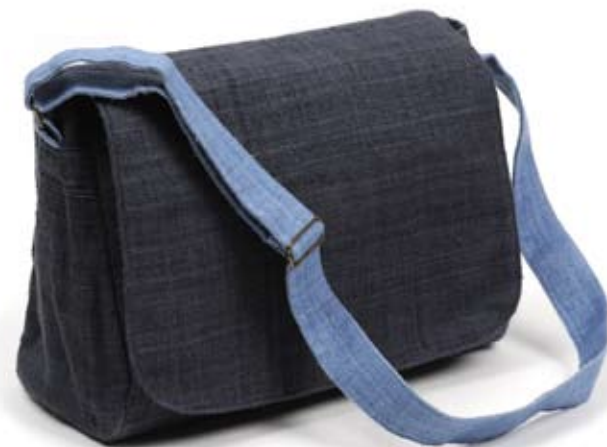
42449 Borsa Unisex in canapa con tracolla blu, cm 35x25x16+125x4, conf 1