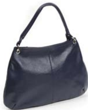
42483 Borsa Duffel in pelle blu indigo, cm 42x28x45, conf 1

Borsa in morbida pelle piatta da portare a tracolla, con patella e tasche interne. Manico lungo e regalabile. Non foderata. Pubblico giovane ed unisex.