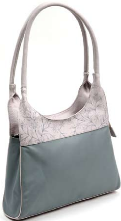
42476 Borsa Spring in pelle stampata, grigio e glicine, cm 56x34, conf 1