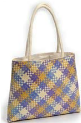
42509 Borsa Sea in foglia di palma intrecciata e colorata, bianco,pistacchio, azzurro, glicine, cm 35x30+ cm 1,5x55, conf 2