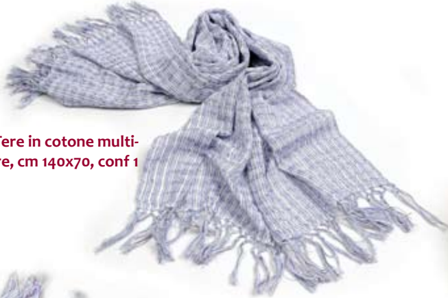
42414 Pareo Tere in cotone multicolore, cm 140x70, conf 1