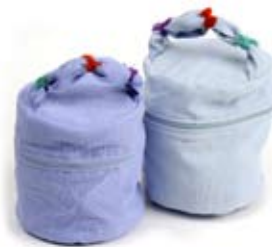
42422 Beauty Playa di cotone azzurro - glicine, cm 15 diamx13 + 12x3, conf 2