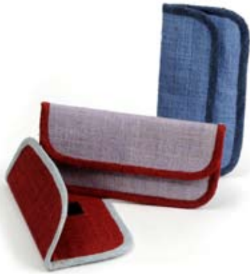
42444 Bustina Gaia in canapa blu - glicine - fragola, cm 18x8, conf 3