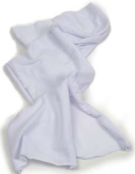
42524 Sciarpina Gabri in jersey di cotone bianco, cm 160x25, conf 2

Sciarpine in cotone tessuto a multi-righe colorate, leggere e spiritose. Sciarpine di tendenza in jersey di cotone organico, lunghe e morbide da proporre separatamente ed in abbinata all'abito Gabri. Pubblico giovane.