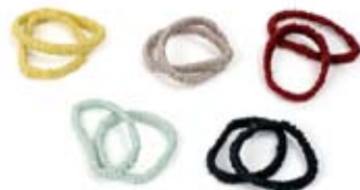
42467 Elastico doppio per capelli Eva in raso di seta, blu - azzurro - glicine - fragola, unica, conf 4

Ampia borsa dalla forma ovale. Realizzata in seta grezza e foderata in cotone stampato artigianalmente con la tecnica del blockprinting. Manici originali realizzati in sottili tubolari di seta multicolore; giocando coi manici si chiude la borsa. Coordinati nei colori della seta sono disponibili gli elastici doppi per capelli. Note: Lavare a secco.