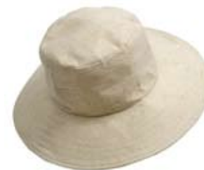
42546 Cappello Asia in cotone bianco, diam cm 19/15x8,7+cm 8, conf. 2