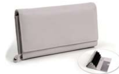
42498 Portafoglio grande donna in pelle glicine, cm 19x11, conf 2

Pratico accessorio in pelle che funge sia da portamonete che da portachivi con un anello metallico interno ed estraibile. Taschina esterna laterale. Coordinato nei nuovi colori della collezione. Target giovane.