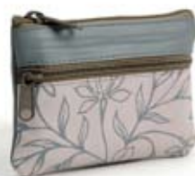
42478 Portamonete Spring in pelle stampata, grigio e glicine, cm 10x7, conf 2

Novità di questa primavera la pelle stampata con motivi floreali in tono su tono per un coordinato semplice, femminile ed originale. La borsa ha un ampio manico. Chiusura con cerniera ed è foderata in cotone. Coordinati il portamonete ed il portafogli. Da proporre in primavera ad un target adulto.