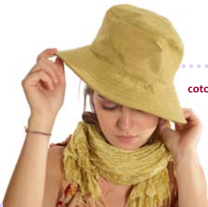
42898 Cappello Asia in cotone pistacchio, diam cm 19/15x8,7+cm 8, conf. 2