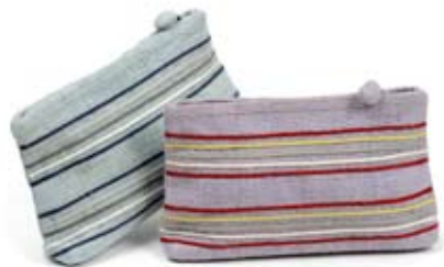
42448 Bustina Stripes in canapa glicine - azzurro, cm 21/19x13x5, conf 2

Ampia borsa in resistente canapa. Apertura particolare con zip diagonale su forma a rombo arrotondata. Righe multicolore applicate e base semirigida per mantenere la forma. Bustina multiuso coordinata. Stile femminile e amante dei tessuti naturali. Target ampio. Note: Lavare a mano