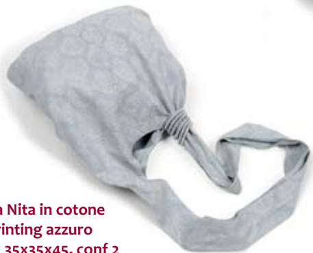
42463 Sacca Nita in cotone con blockprinting azzurro polvere, cm 35x35x45, conf 2

Immancabili le sacche doubleface in leggero e resistente cotone, stampato con la tecnica artigianale del blockprinting. Disegno tradizionale indiano. Bangle ricoperti di tessuto ad impreziosire. Coordinati negli stessi colori gli elastici doppi per i capelli. Target giovane. Note: Lavare a 30°