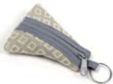
42544 Portachiavi Miriam in cotone con ricamo grigio, conf. 2, cm 7x9