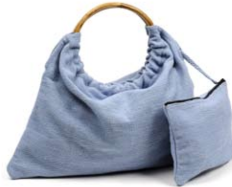
42555 Borsa Fair lady in cotone con bustina azzurro, cm 45x30,, conf 1

Borsa in canvas di cotone tessuto e fodera in cotone lavorato a tie & die. Particolare manico a cerchio in bamboo. Pratica bustina annessa alla borsa. La borsa può essere utilizzata doubleface per due stili diversi: uno più semplice e classico, uno più estroso che valorizza la stampa artigianale. Coordinati il portamonete e le bustine porta macchina digitale con chiusura a zip. Note: Lavare a mano.