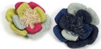
42450 Spille Gaia in canapa a fiore, fragola blu, cm 6/7 diam, conf 4

Semplice borsina piatta in canapa con manici e bordi in contrasto di colore. Coordinati portamonete, bustina e portacellulare con pratica tracollina. Disponibili anche le spille a forma di fiore, con cui si può giocare per impreziosire la borsa a seconda del gusto e dell'occasione. Per tutti i giorni. Target giovane. Note: Lavare a mano.