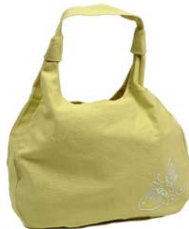
42474 Borsa Mariposa in canvas di cotone con ricamo pistacchio, cm 40x38, conf 1