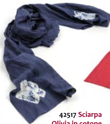
42517 Sciarpa Olivia in cotone tye&die blu, cm 200x40, conf 2