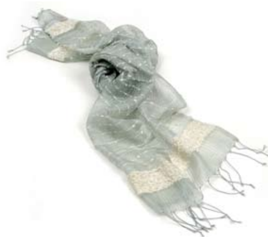
42531 Stola Marilù in seta e viscosa 011, azzurro polvere/glicine, cm 180x40, conf 2