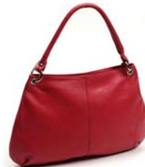
42485 Borsa Duffel in pelle fragola, cm 42x28x45, conf 1

Borsa in pelle di medie dimensioni, semplice e femminile da usare tutti i giorni. Chiusura con cerniera. Pubblico ampio e trasversale.