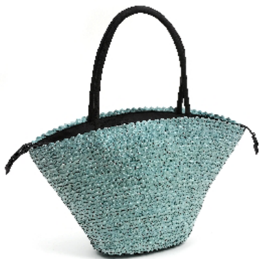
42510 Borsa Palm leaf in fibra azzurro, cm 30/55x56h + 20x13, conf 2