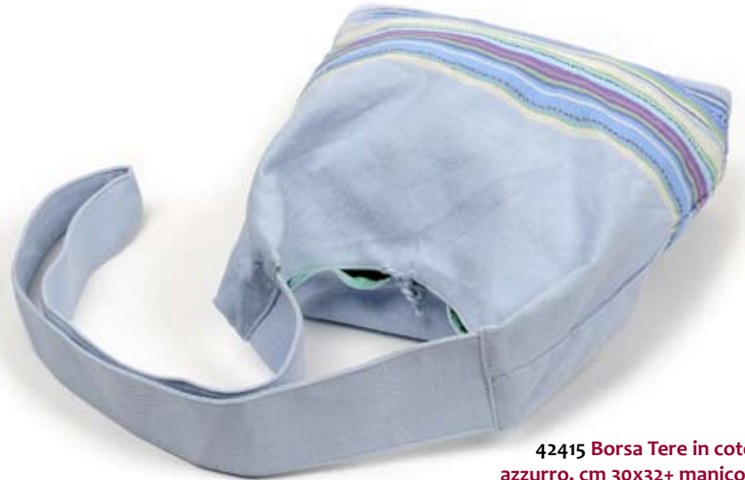
42415 Borsa Tere in cotone azzurro, cm 30x32+ manico cm 100x3, conf 1