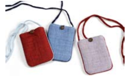
42443 Borsina portacellulare Gaia in canapa blu-glicine-fragola, cm 9x12, conf 3