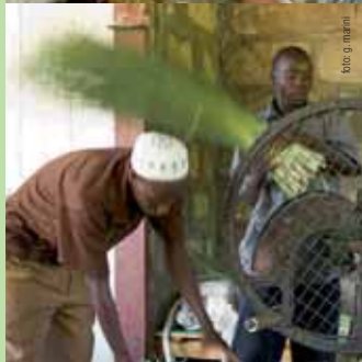
bio: g. marini